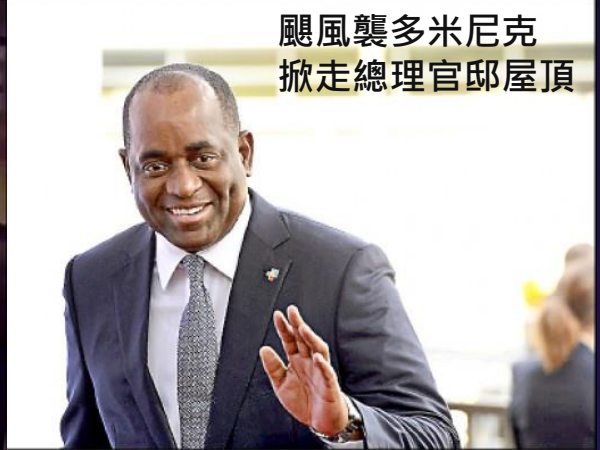
颶風襲多米尼克 掀走總理官邸屋頂